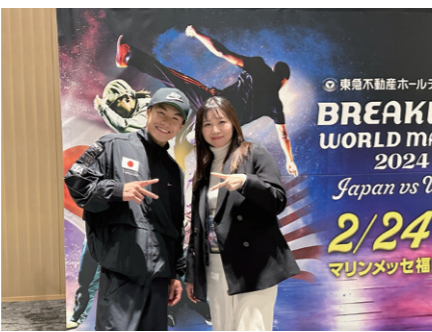
2/24 「BREAKING WORLD MATCH2024」(主催:福岡県他)に参加。世界ランキング1位のShigekixさんと。

3/10 パリアアカデミー主催「なぜ女性リーダーが必要か〜女性議員が語る地域の未来〜」シンポジウムにOGとしてパネリスト参加しました。