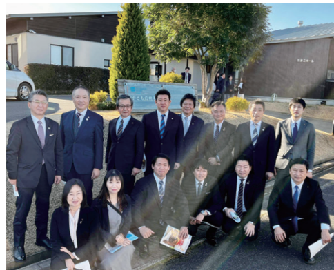
1/16 子育て支援・人財育成調査特別委員会で福岡市西区の「子どもの村SOS JAPAN」を視察。