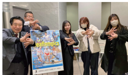
1/30 昨年4月に制定された「福岡県手話言語条例」の制定記念講演に参加。保護者の方々と意見交換も行いました。