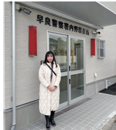
1/16 建て替え中だった内野駐在所が完成。落成式に参加しました。