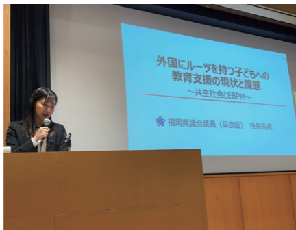
1/19 「まちづくりとEBPM」シンポジウムに登壇。「外国にルーツを持つ子どもへの教育支援の現状と課題」について報告しました。