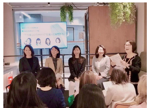
2/14 福岡県事業「福岡キャリアカフェ」の団体連携企画で「天神キャリア塾」にパネリスト参加。