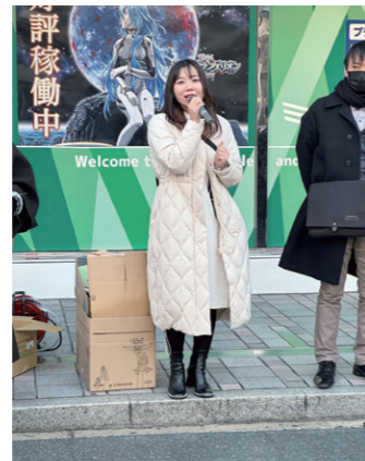
1/14 「学校の働き方改革について考える福岡県集会」に参加。街頭で教員不足の現状を訴えました。