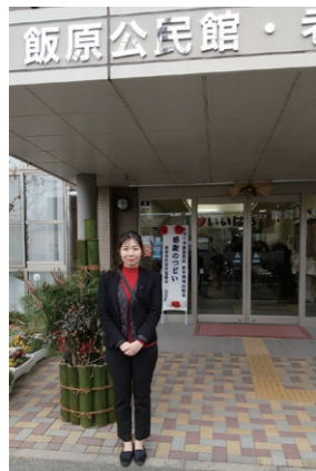
1月は新年交流会や餅つき、ほうけんぎょうなどでたくさんの方々と交流し、お声を聞くことができました。