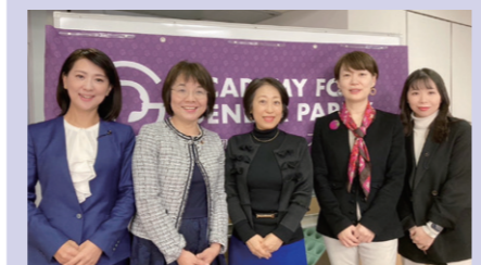
TV放映の様子はコチラ→私も取材を受けました!

3/10 パリアアカデミー主催「なぜ女性リーダーが必要か〜女性議員が語る地域の未来〜」シンポジウムにOGとしてパネリスト参加しました。