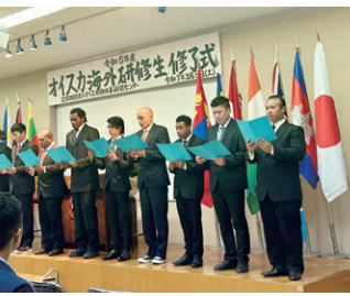
3/8 早良区小笠木にあるオイスカ西日本研修センターの研修生修了式に参加しました。